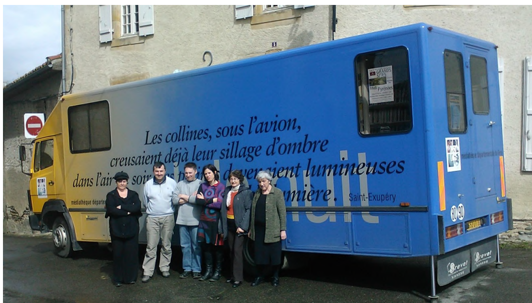
Les équipes de la Médiathèque Départementale du Gers et de la Médiathèque de Riscle travaillent ensemble pour proposer de nouvelles collections aux publics, ici à l'occasion du passage du Bibliobus.

Suite à ces efforts, on constate que ce plan de développement a déjà eu un impact favorable sur les collections, la fréquentation et l'image de la Médiathèque. (Bilans disponibles sur www.mediaqers.fr/riscle )